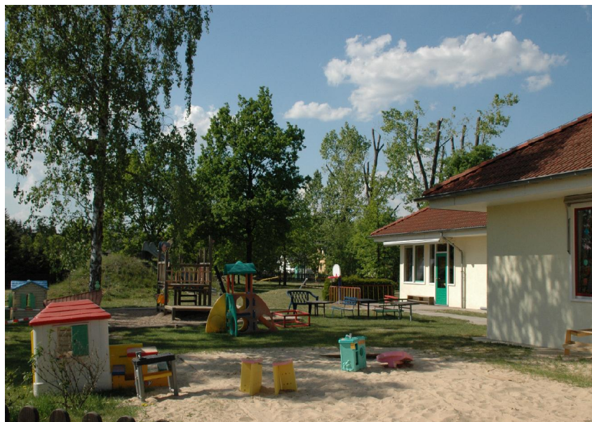
Unser schöner Kita-Garten mit Spielplatz

Natürlich hat der Vorstand im Anschluss an die Gründung des Vereins sich sofort um die Anerkennung als gemeinnützigen Vereins bemüht. Dank der schnellen Bearbeitung, durch die für uns zuständige Mitarbeiterin im Finanzamt Königs Wusterhausen, liegt uns die vorläufige Anerkennung nun seit dem 29.03.2007 vor. Dadurch ist es uns möglich, ab sofort Spendenbescheinigungen für Geld- oder Sachspenden ausstellen zu können. Jeder, der also